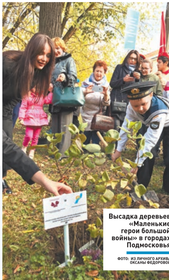
Высадка деревьев «Маленькие герои большой войны» в городах Подмосковья